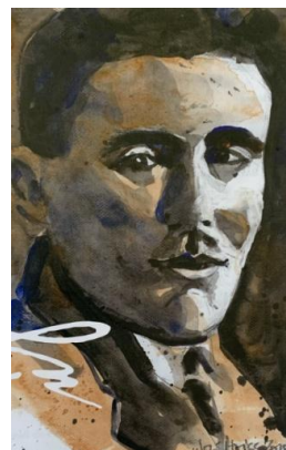
Josef Rambeck – Aquarell von Uli Hoiß

Sonntag, 25. Januar 2026 Einlass 10:30 Uhr Beginn 11 Uhr (Dauer bis 15 Uhr) in die Georg-von-Vollmar-Akademie Am Aspensteinbichl 9, 82431 Kochel am See